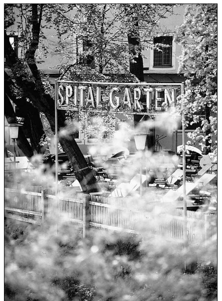
Der Biergarten auf der anderen Seite der Donau

Doch Regensburg musste sich immer schon öffnen. Weil die Donau vorbeifloss und neben Seide, Pelzen, feinem Tuch und vor allem Salz auch fremde Einflüsse hereinspülte. Die reichen Patrizier hatten Handelsbeziehungen nach Kiew im Osten und nach Venedig im Süden. Vom alten Rathaus aus machte Regensburg Geschichte: Nach dem Dreißigjährigen Krieg residierte hier der Immerwährende Reichstag. Gesandte aus ganz Europa ent-