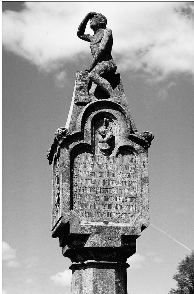
Das Bruckmandl schaut von der Steinerne Brücke zum Dom FOTOS: HERBERT GRABE

Sitzt man an einem der alten Bistrotische im Orphée in der