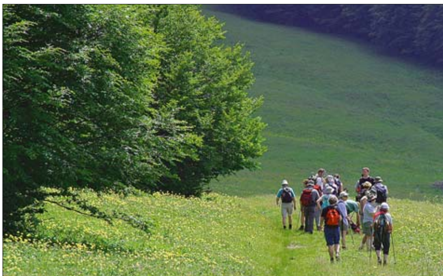
Wanderung inmitten eines Meeres von Trollblumen.